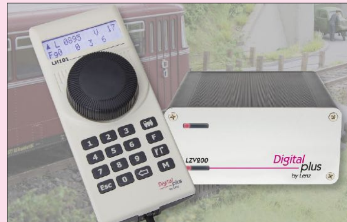
60101 SET101 Einsteigerset mit LZV200 und LH101

und Mehrfachtraktion sind komfortabel einrichtbar. Bis zu 2048 Weichen, Signale und andere Zubehörartikel sind schaltbar, im Handregler können Weichenstraßen abgelegt werden. Einstellungen an Lokdecodern können per PoM oder auf dem Programmiergleis vorgenommen werden. Die LZV200 stellt einen maximalen Strom von 5A zur Verfügung, bei Bedarf kann mit weiteren Verstärkern LV103 erweitert werden.