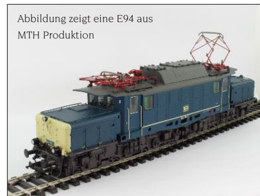
Abbildung zeigt eine E94 aus MTH Produktion