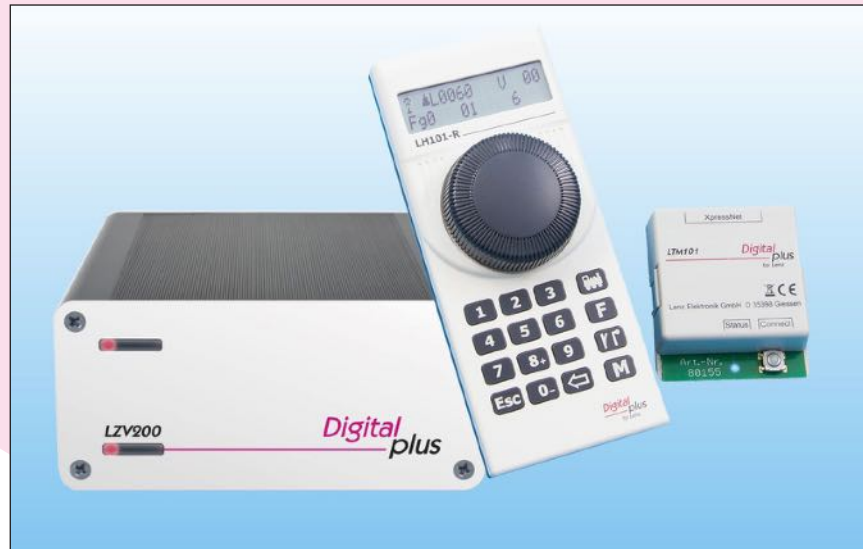
60103 SET101-R Einsteigerset mit LZV200, LH101-R, LTM101

Das SET101-R, die drahtlose Variante, verfügt über den selben Funktionsumfang wie das SET101 und besteht aus der Zentralen-Verstärker-Kombination LZV200 und dem Funkhandregler LH101-R.