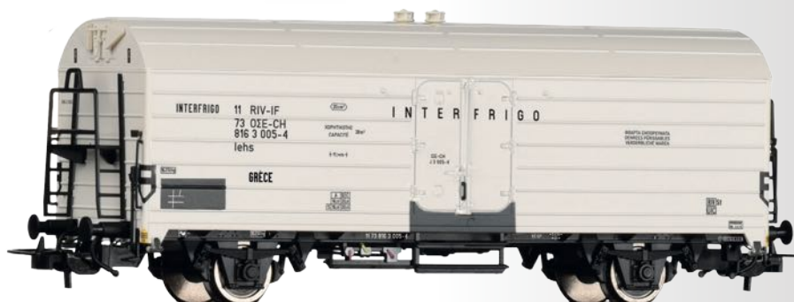
Kühlwagen lehs „Interfrigo“ der OSE Refrigerator car lehs “Interfrigo” of the OSE