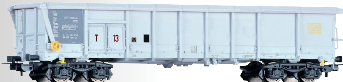
Rolldachwagen Tamns der SNCF Sliding roof car Tamns of the SNCF