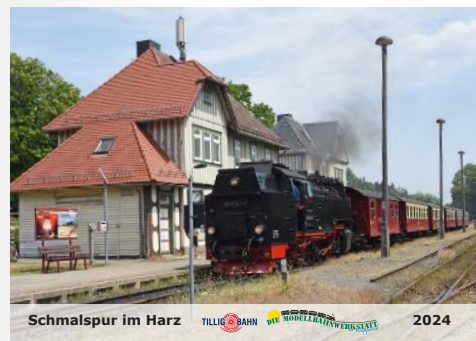
Schmalspur-Kalender 2024 Narrow-gauge calendar 2024