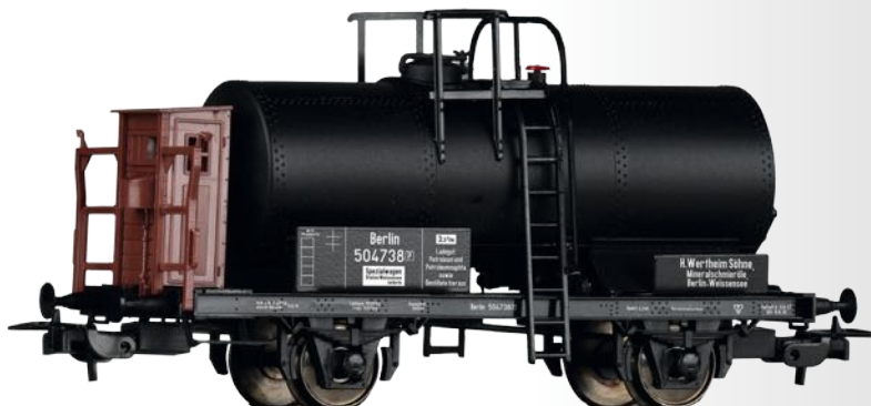
Kesselwagen „H. Wertheim Söhne“, eingestellt bei der K.P.E.V. Tank car "H. Wertheim Söhne" of the K.P.E.V.