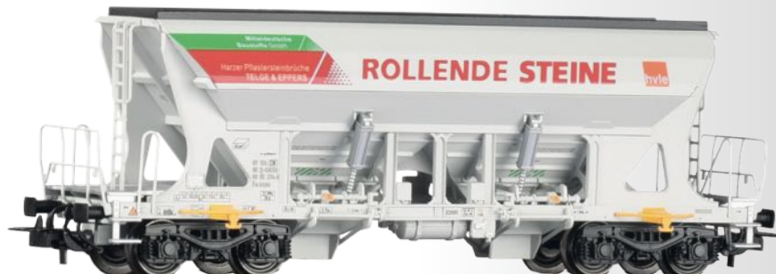
Selbstentladewagen Faccns der GATX / HVLE / Mitteldeutsche Baustoffe Hopper car Faccns of the GATX /HVLE / Mitteldeutsche Baustoffe