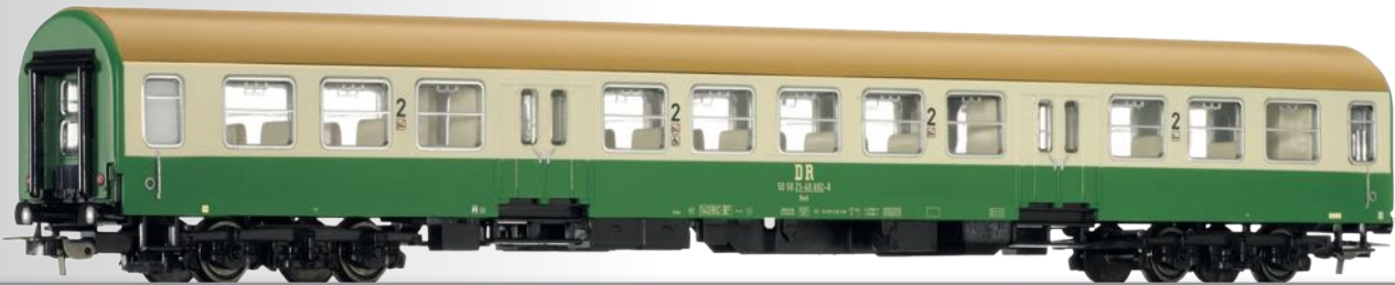
Abb. zeigt Art. 74979

Reisezugwagen 2. Klasse Bmh, Bauart Halberstadt, der DR, 2. Betriebsnummer 2nd class passenger coach Bmh, type Halberstadt, of the DR, 2nd operation number • Passend zu / Additional to 74979