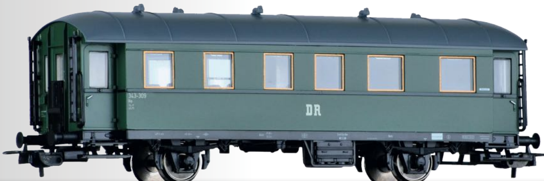
Personenwagen 2. Klasse Bip der DR, 2. Betriebsnummer 2nd class passenger coach Bip of the DR, 2nd operation number