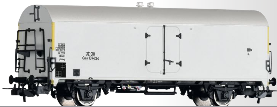
Kühlwagen Gmv der JZ Refrigerator car Gmv of the JZ