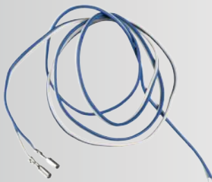
2-pol. Anschlusskabel mit Flachsteckhülse für Straßenbahngleis 2 pole power connecting with socket for tram track