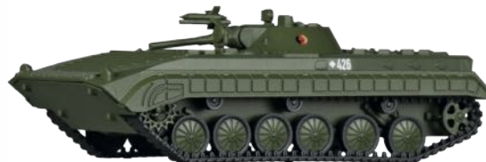
Schützenpanzer BMP-1 „NVA“ Tank type BMP-1 „NVA“