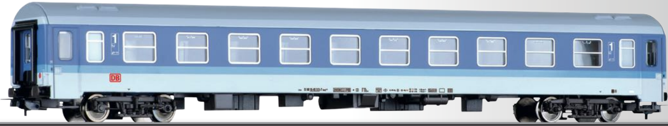
Reisezugwagen 1. Klasse Amz 210 der DB AG 1st class passenger coach Amz 210 of the DB AG