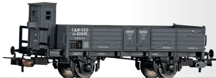
Offener Güterwagen JG der CES Open car JG of the CES