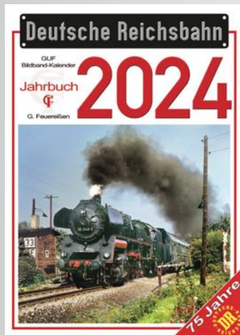
DR-Kalender 2024 DR calendar 2024 (Feuereiben Verlag)