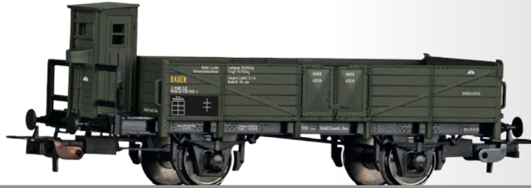
Offener Güterwagen Omk der Süddeutschen Eisenbahn-Gesellschaft Open car Omk of the Süddeutschen Eisenbahn-Gesellschaft