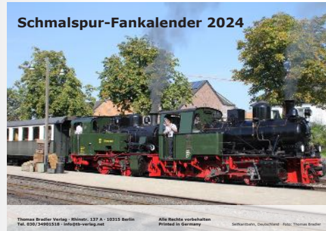
Schmalspur-Fankalender 2024 Narrow-gauge Fancalendar 2024 (Bradler-Verlag)