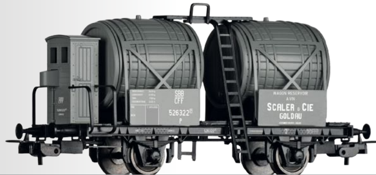
Weinfasswagen „Scaler & Cie.“, eingestellt bei den SBB Wine barrel car “Scaler & Cie.” of the SBB