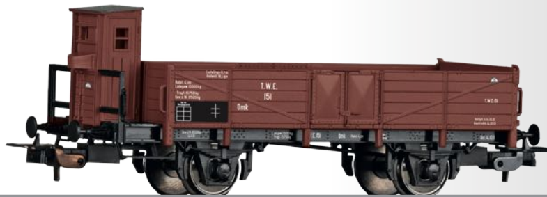
Offener Güterwagen Omk der Teutoburger Wald Eisenbahn (TWE) Open car Omk of the Teutoburger Wald Eisenbahn (TWE)