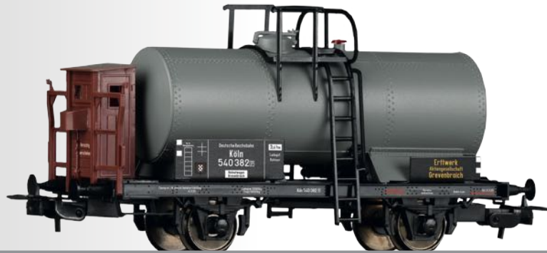
Kesselwagen „Erftwerk Aktiengesellschaft Grevenbroich“, eingestellt bei der DRG Tank car “Erftwerk Aktiengesellschaft Grevenbroich” of the DRG