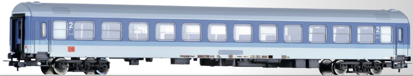
Reisezugwagen 2. Klasse Bimz 256 der DB AG 2nd class passenger coach Bimz 256 of the DB AG