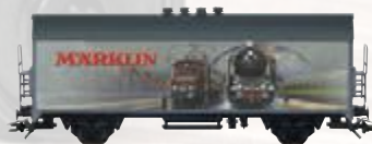
45900 Märklin-Katalogwagen 1929 – Nutzen Sie bitte zum Wechsel den Gleichstromradsatz E32376004