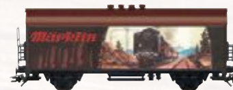
45901 Märklin-Katalogwagen 1930 – Nutzen Sie bitte zum Wechsel den Gleichstromradsatz E32376004