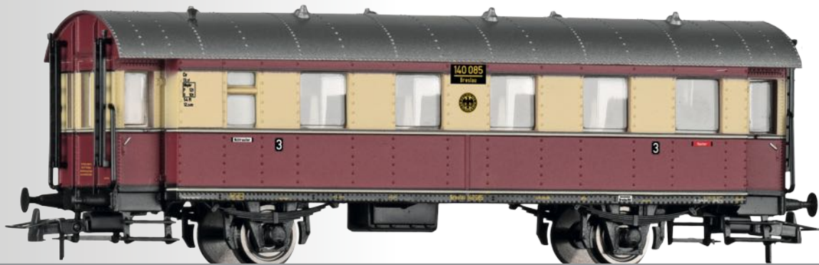
Beiwagen Cv-33 der DRG Trailer car Cv-33 of the DRG