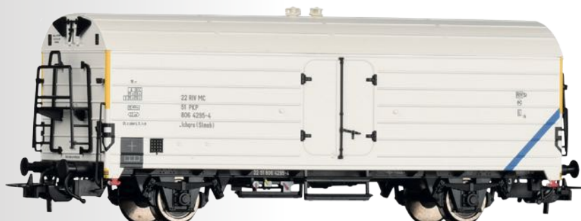
Kühlwagen Ibchqs der PKP Refrigerator car Ibchqs of the PKP