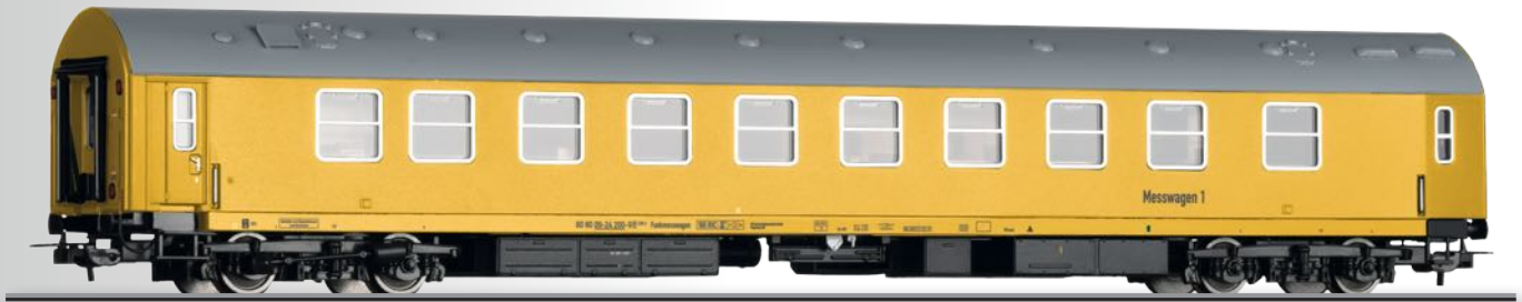
Funkmesswagen 296.3 der DB Kommunikationstechnik GmbH Radiomeasuring car 296.3 of the DB Kommunikationstechnik GmbH