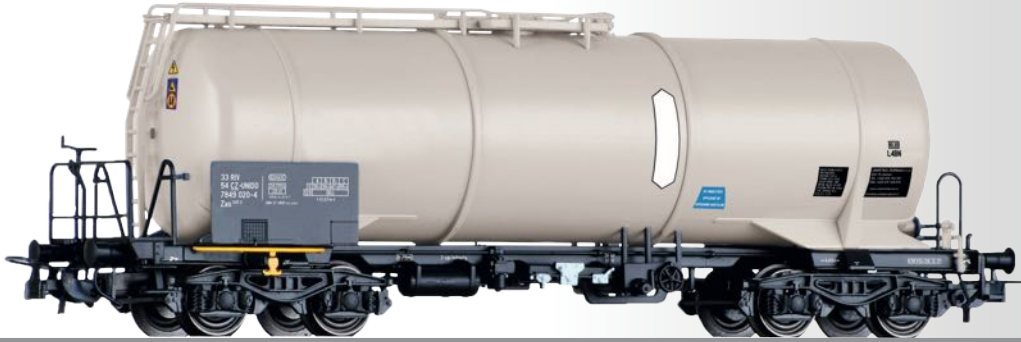
Kesselwagen Zas der Unipetrol Doprava s.r.o. (CZ) Tank car Zas of the Unipetrol Doprava s.r.o. (CZ)