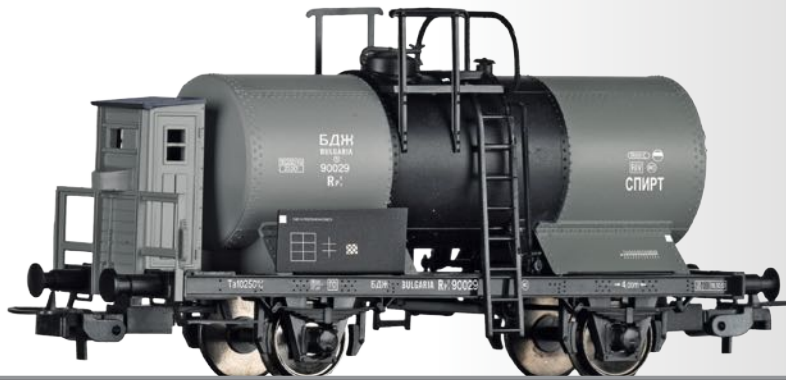
Kesselwagen Rpf der BDZ Tank car Rpf of the BDZ