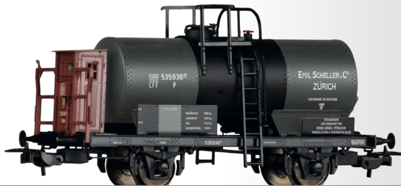
Kesselwagen „Emil Scheller & Cie., Zürich“, eingestellt bei den SBB Tank car „Emil Scheller & Cie., Zürich“ of the SBB