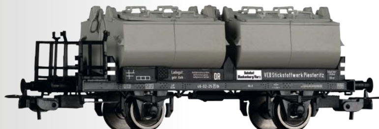
Kalkkübelwagn Ok der DR Lime transport car Ok of the DR