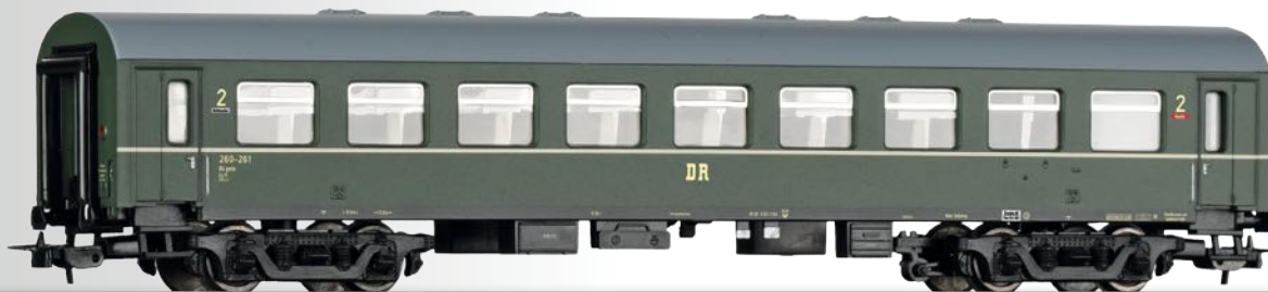
Reisezugwagen 2. Klasse B4gmle der DR 2nd class passenger coach B4gmle of the DR