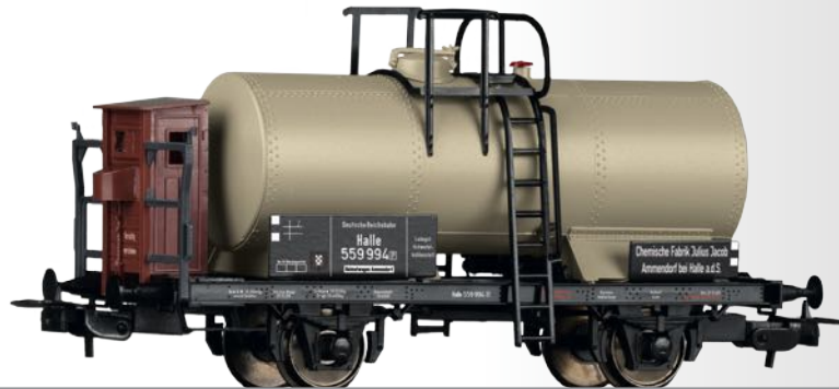
Kesselwagen „Chem. Fabrik Julius Jacob, Ammendorf“, eingestellt bei der DRG Tank car “Chem. Fabrik Julius Jacob, Ammendorf” of the DRG