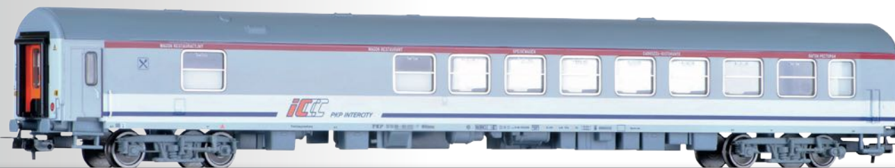
Speisewagen WRdmu der PKP Intercity Dining car WRdmu of the PKP Intercity