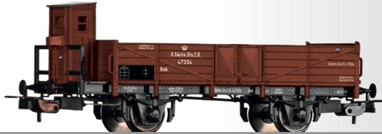
Offener Güterwagen Omk der K.Sächs.Sts.E.B. Open car Omk of the K.Sächs.Sts.E.B.