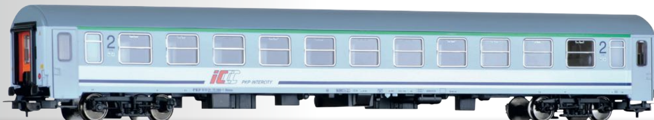
Reisezugwagen 2. Klasse Bdmu der PKP Intercity 2nd class passenger coach Bdmu of the PKP Intercity