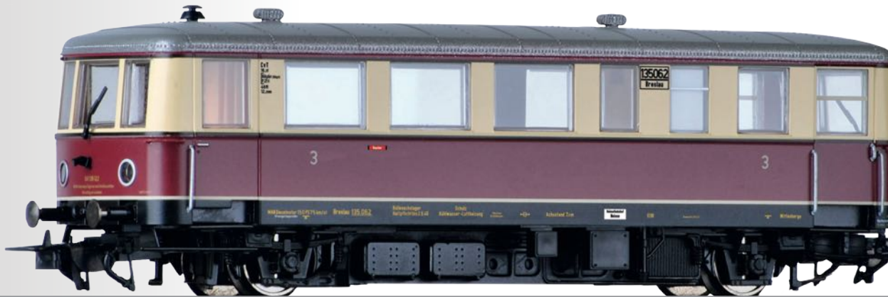
Triebwagen CvT 135 mit Beiwagen CPostv-36 der DRG Railbus class CVT 135 with trailer car CPostv-36 of the DRG