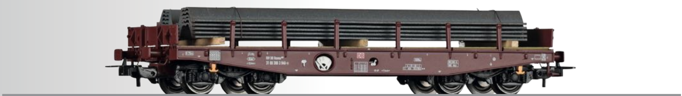
Schwerlastwagen Rmms 662 der DB AG, beladen mit Spundwänden Flat car Rmms 662 of the DB AG with load