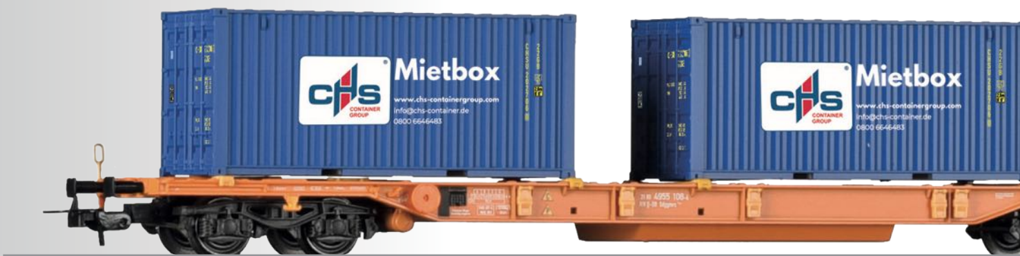
FORMNEUHEIT: Doppeltragwagen Sdggmrs 744 der DB AG, beladen mit vier Containern „CHS Container Handel GmbH“ NEW: Container Car Sdggmrs 744 of the DB AG with four container “CHS Container Handel GmbH”