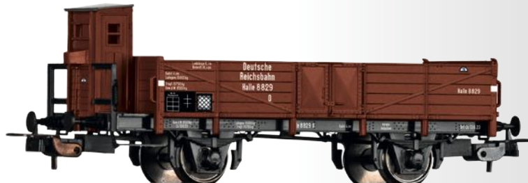
Offener Güterwagen O Halle der DRG Open car O Halle of the DRG