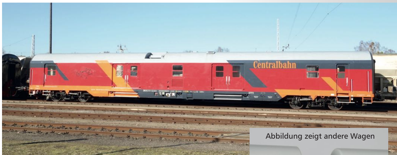
Abbildung zeigt andere Wagen

Please note: All the following models are unique editions, last date of order: 31st march 2024