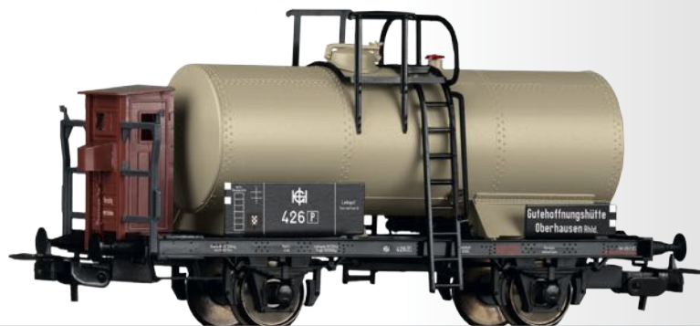
Kesselwagen der Gutehoffnungshütte Oberhausen Tank car of the Gutehoffnungshütte Oberhausen