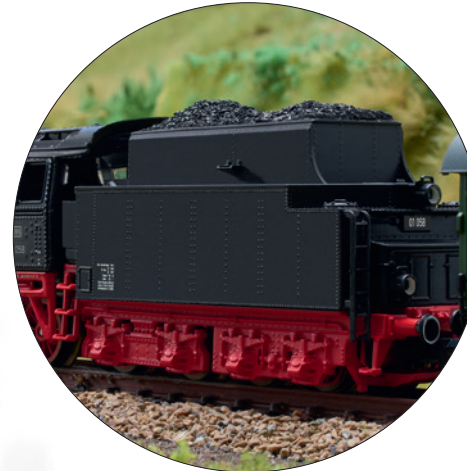
Erstmalig eine BR 01 mit Kurztender der Bauart 2'2 T30

Neukonstruktion des Kurztenders der Bauart 2'2 T30 100 Jahre Baureihe 01 Bestellschluss 28.02.2025