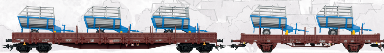
46407 Güterwagen-Set 2 Landwirtschaftliche Geräte – Nutzen Sie bitte zum Wechsel den Gleichstromradsatz E700580