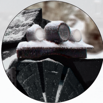
Arbeitsscheinwerfer und Streckensignallampen digital schaltbar